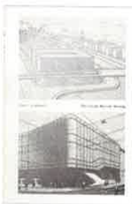
Christoph Merian Stiftung (Hg.): Basel ungebaut. Christoph Merian Verlag, Basel 2022, 240 S., CHF 39.–

Es gibt zahlreiche architektonische Ideen und Projekte, die für Basel entwickelt, aber nicht realisiert wurden: von den Plänen für ein neues Stadtcasino im 19. Jahrhundert über das Kasernenareal und die verschiedenen Projekte für Rheinbrücken bis zum Bau eines Ozeaniums in unserer Zeit. Die Ausstellung «Die geträumte Stadt» im Museum Kleines Klingental präsentierte bis im März anhand von Modellen und Plänen bislang wenig bekannte Ideen aus dem 20. Jahrhundert für Basel, die nicht realisiert worden sind, und stellte sie in den aktuellen Kontext. Die Publikation Basel ungebaut verfolgt diese Spur mit bisher zum Teil unveröffentlichtem Bild- und Textmaterial weiter, verbunden mit der Hoffnung, dass die nicht realisierten Projekte neben dem tatsächlich Gebauten als wertvoller Fundus von Möglichkeiten verstanden werden und die Debatten um die zukünftige Gestalt der Stadt bereichern. Einige Basler Architekturbüros wie Herzog & de Meuron oder Diener & Diener haben zudem ihr eigenes nicht umgesetztes Lieblingsprojekt für die Publikation ausgewählt. Peter Egli