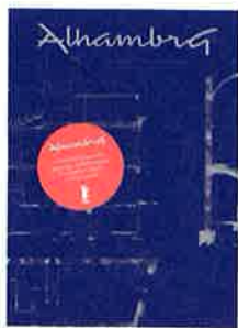
Catherine Courtiau: L'Alhambra. Une salle polyvalente historique. Éditions La Baconnière, Chêne-Bourg 2021, 144 p., CHF 37.–

Ouvert en 1920 à Genève, l'Alhambra était une des premières salles de cinéma en Suisse – et la plus grande, puisqu'elle offrait 1400 places pour des projections et des spectacles de scène. En 1928, elle sera équipée pour le cinéma parlant et présentera des films en couleurs dès les années 1950. Dans la première partie de cette publication dédiée au centenaire de l'Alhambra, l'historienne de l'art et de l'architecture Catherine Courtiau retrace l'histoire de ce monument, son architecture et ses diverses affectations. Une riche iconographie fait revivre ce passé, par des plans et des vues de l'édifice, des photos des spectacles ou en-